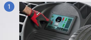
1 Ecran tactile « Pro Touch » breveté