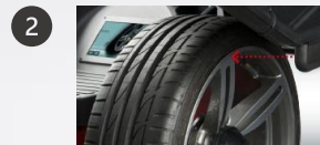
2 Smart Sonar: mesure automatique de la largeur de jante