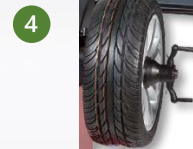
4 Serrage manuel avec manivelle rapide