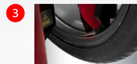
3 Easy weight : pointeur laser pour le positionnement des masses cachées avec répartition derrière les bâtons